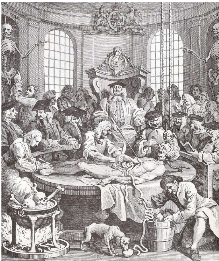
Вільям Хогарт. Чотири стадії жорстокості. Відплата за жорстокість. Гравюра. 1751 р.