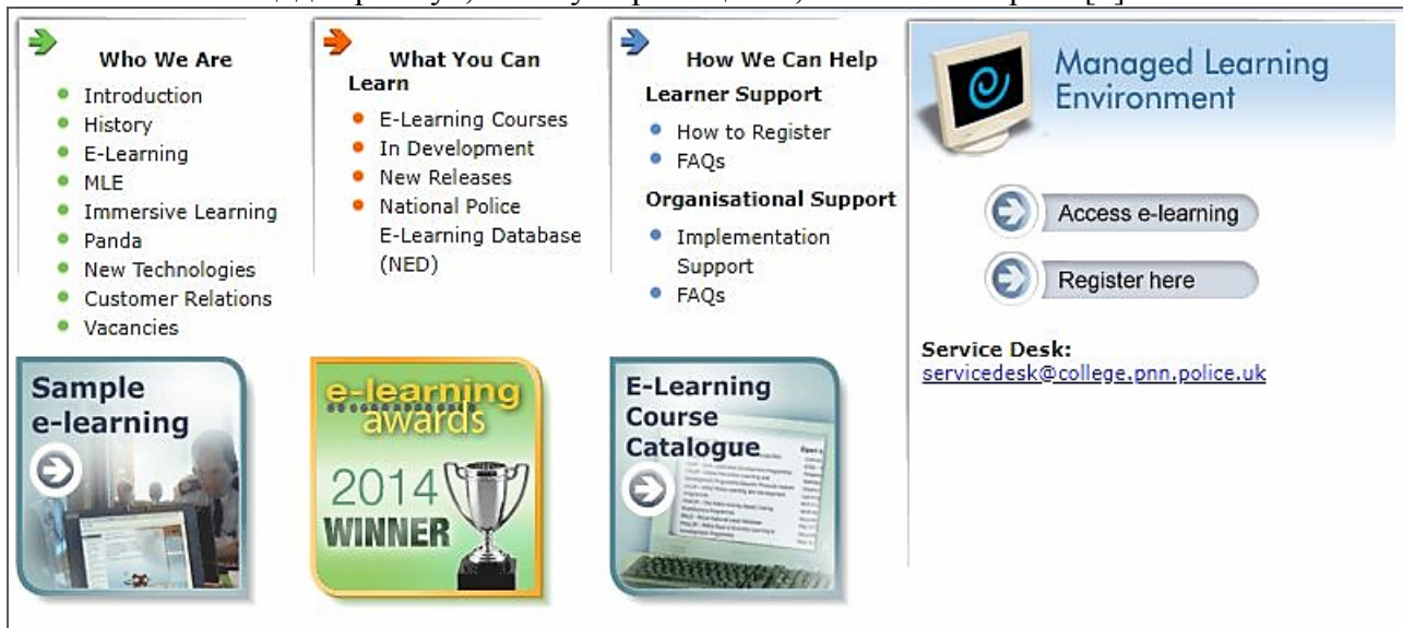
Рис. 1. Портал Національного центру прикладних технологій навчання (NCALT)

Як приклад, зазначимо, що до останньої програми входять: «Управління конфліктами», «Боротьба з тероризмом», «Невідкладні процедури», «Допити та опитування», «Повноваження щодо арешту», «Обшук приміщень», «Раптова смерть» [2].