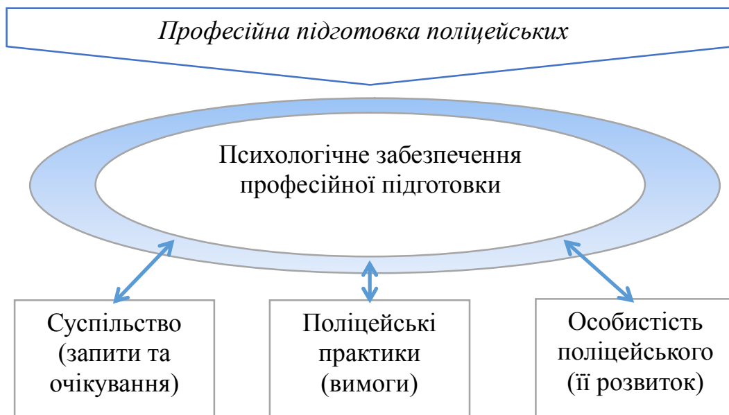
Рисунок 1 – Взаємодія системи «Психологічне забезпечення» із системами «Суспільство», «Поліцейські практики», «Особистість»

Таким чином, вищезазначене дає можливість стверджувати, що сутність психологічного забезпечення професійної підготовки поліцейських як системи визначається сукупністю вимог, які до якості професійної підготовки поліцейських висувають такі системи, як «Суспільство», «Професійні практики поліціювання» та «Особистість». Суспільство вимагає перш за все формування високоморального, відкритого, відповідального професіонала. Професійні практики акцентують на спроможності поліцейського успішно виконувати безліч службових функцій, а глибинний зміст психологічної підтримки як феномена полягає у складних процесах і перетвореннях, що зачіпають ядро людини – її особистість (рис. 1).