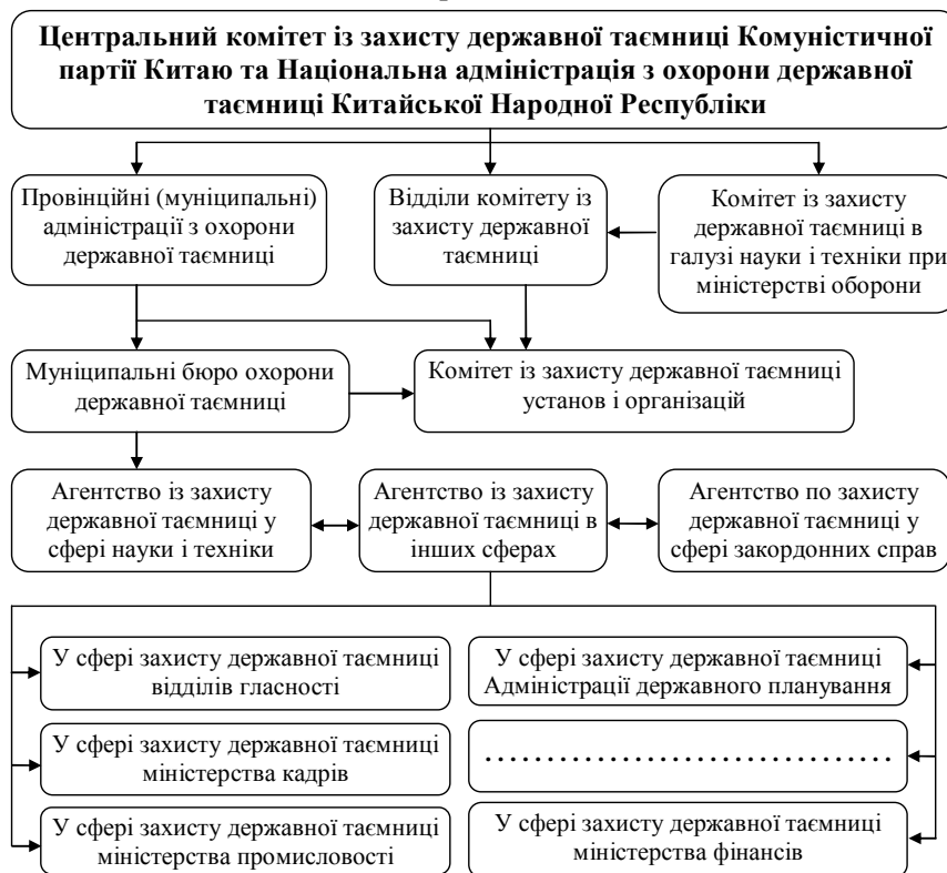
Рис. 3. Система адміністративних органів, що відповідають за охорону державних таємниць у КНР

жавної таємниці. Поряд із ним у КНР також існує аналогічний партійний орган – Центральний комітет із захисту державної таємниці, що підпорядковується Центральному комітету Комуністичної партії Китаю. В особливих адміністративних районах Китаю – Гонконгу і Макао – діє своя система класифікації та захисту секретної інформації [4]. Систему адміністративних органів, що відповідають за охорону державної таємниці в КНР, схематично зображено на рис. 3.