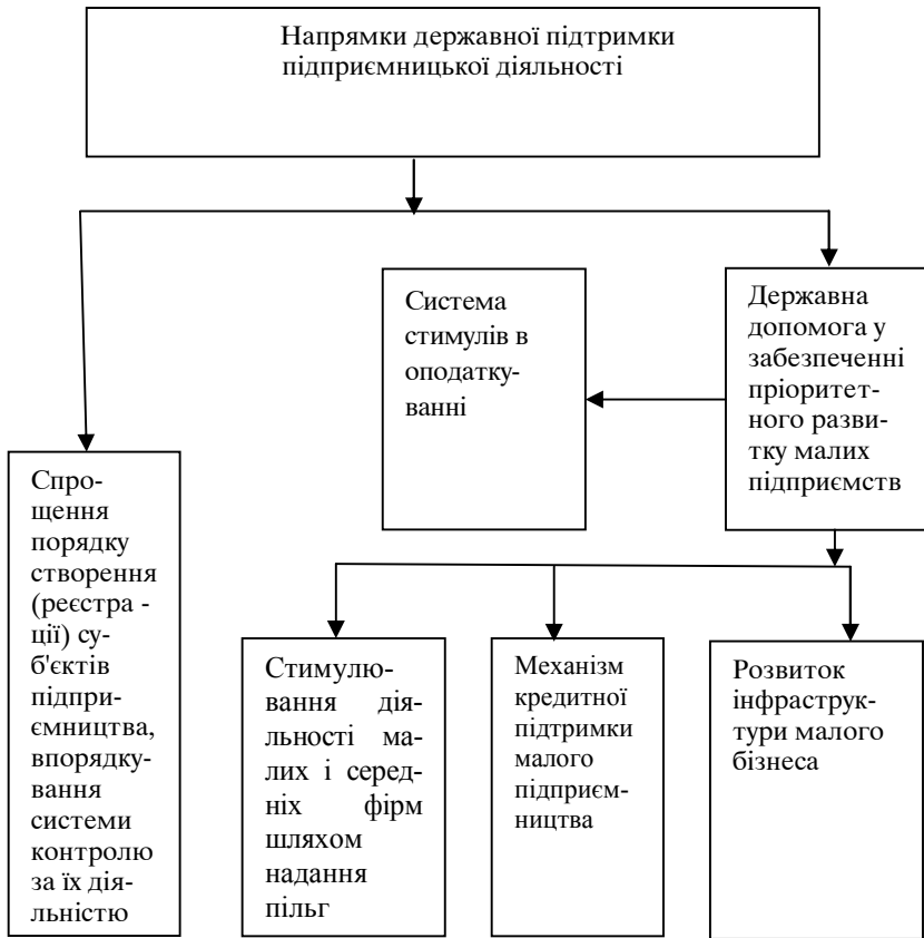
Рис. 2. Напрямки державної підтримки підприємницької діяльності

Найбільш суттєву проблему адміністративні бар'єри становлять для суб'єктів малого підприємництва. Вони, по-перше, відчувають труднощі оплати виходу на ринок «авансом», тоді, коли їх діяльність ще не розпочалась. По-друге, – витрати, що виникають на етапі створення підприємства, можна віднести до постійних. З цієї точки зору МБ позбавлений переваги подолання адміністративних бар'єрів за рахунок економії на масштабі.