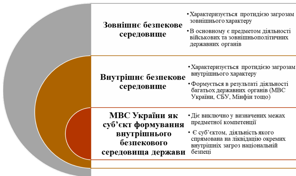
Рис. 1. МВС України як суб'єкт формування внутрішнього безпекового середовища держави

характеру в межах території нашої держави. Аналогічні сфери життєдіяльності держави належать до сфери внутрішньої безпеки і в зарубіжних країнах, що дає змогу говорити про ідентичність державної політики щодо забезпечення належного стану захищеності відповідних держав від загроз внутрішнього характеру. Отже, МВС України забезпечує внутрішню безпеку держави шляхом нейтралізації внутрішніх загроз, а тому забезпечує формування та розвиток внутрішнього безпекового середовища держави (рис. 1).