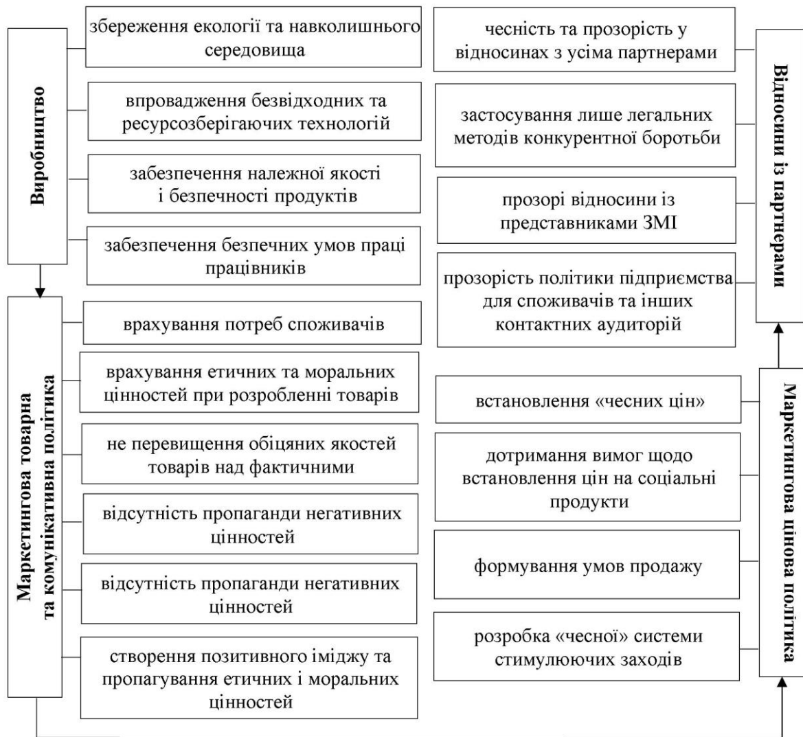
Рис 2. Напрями забезпечення розвитку соціальної відповідальності бізнесу

більше звертати увагу на принципи соціальної відповідальності бізнесу. Така політика є вигідною не лише для споживача, адже соціально-відповідальна діяльність піднімає довіру у споживача до організації, а отже формує позитивний імідж, що впливає на досягненні конкурентних позицій і зайняття лідируючих позицій на ринку (рис. 2).