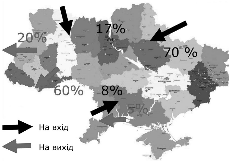
Рис. 2. Структура потоків нелегальних мігрантів, затриманих на кордоні України у 2003–2015 рр.

Міграційне «навантаження» нелегальних мігрантів на різні регіони країни розподіляється нерівномірно. Найбільша їх кількість була затримана у місті Києві, в Одеській, Харківській, Донецькій, Дніпропетровській і Херсонській областях. Це свідчить про те, що масовий прояв нелегальна міграція має у великих містах України, а також у прикордонних зонах, які є місцями переправи нелегальних мігрантів до Європи.